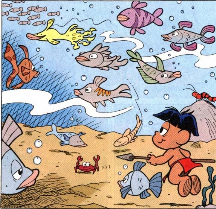
Figura 7 – Papa-Capim iniciando sua reintegração, por baixo e pela esquerda o quadro harmonioso e soberano da diversidade natural.

Fonte: História em quadrinhos do Papa-Capim intitulada “Peixes”. In: MAURICIO DE SOUSA PRODUÇÕES. Chico Bento. São Paulo: Panini Comics, 2011, n.53, p.24.