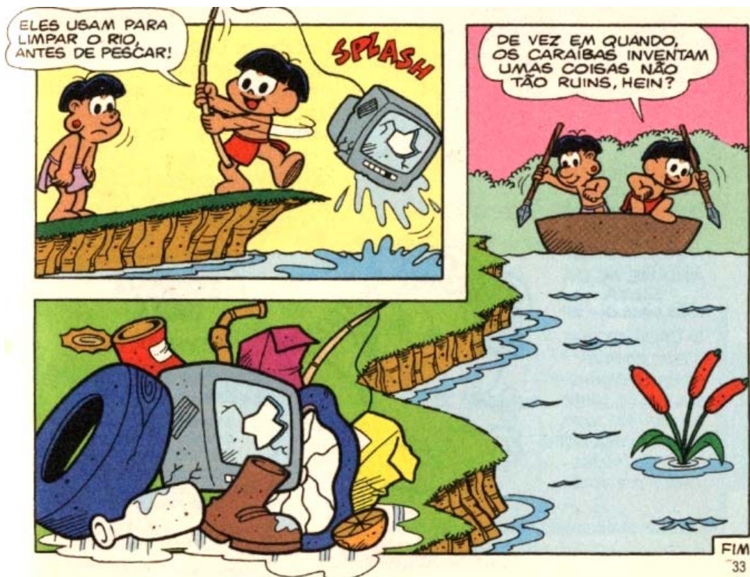
Figura 3 – Papa-Capim e Cafuné inventando dois mundos. A sujeira do mundo exterior deve ser limpa pelas ferramentas do mundo exterior