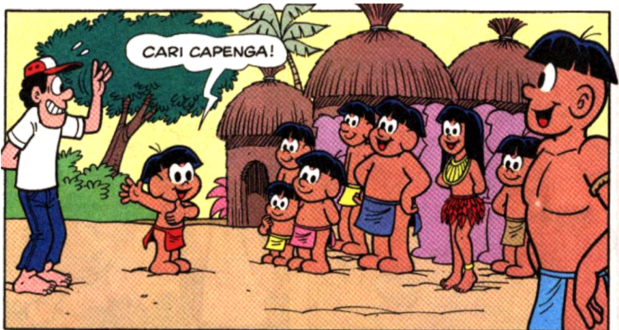
Figura 5 – Receber bem o estranho, desde que seja para renomeá-lo e mudá-lo

Fonte: História em quadrinhos do Papa-Capim intitulada “Cari Capenga”. In: MAURICIO DE SOUSA PRODUÇÕES. Chico Bento. São Paulo: Panini Comics, 2012. n.66, p.50.