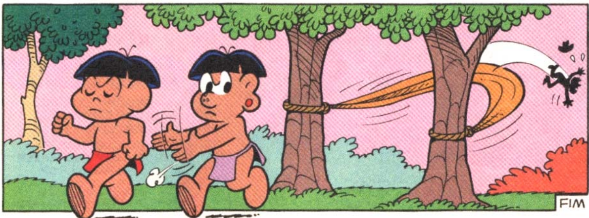
Figura 1 – Papa-Capim e Cafuné expulsando o caiçara ou: os meios modernos de produzir a realidade sobre quem e o que devem ou não pertencer ao quadro da natureza