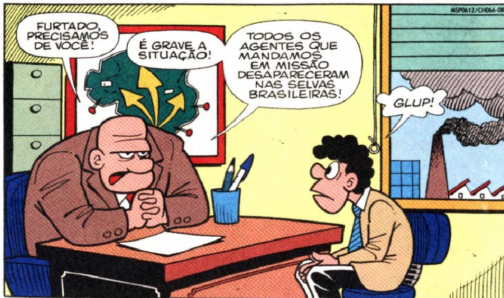
Figura 4 – Os estranhos caminhos para a verdadeira natureza da vida. Furtado sendo intimado pelo chefe a ir para as selvas brasileiras

Fonte: História em quadrinhos do Papa-Capim intitulada “Cari Capenga”. In: MAURICIO DE SOUSA PRODUÇÕES. Chico Bento. São Paulo: Panini Comics, 2012. n.66, p.46.