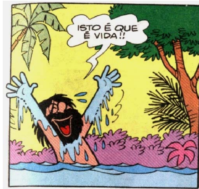
Figura 6 – O caiçara (re)educado e reintegrado à natureza

Fonte: História em quadrinhos do Papa-Capim intitulada “Cari Capenga”. In: MAURICIO DE SOUSA PRODUÇÕES. Chico Bento. São Paulo: Panini Comics, 2012. n.66, p.55.