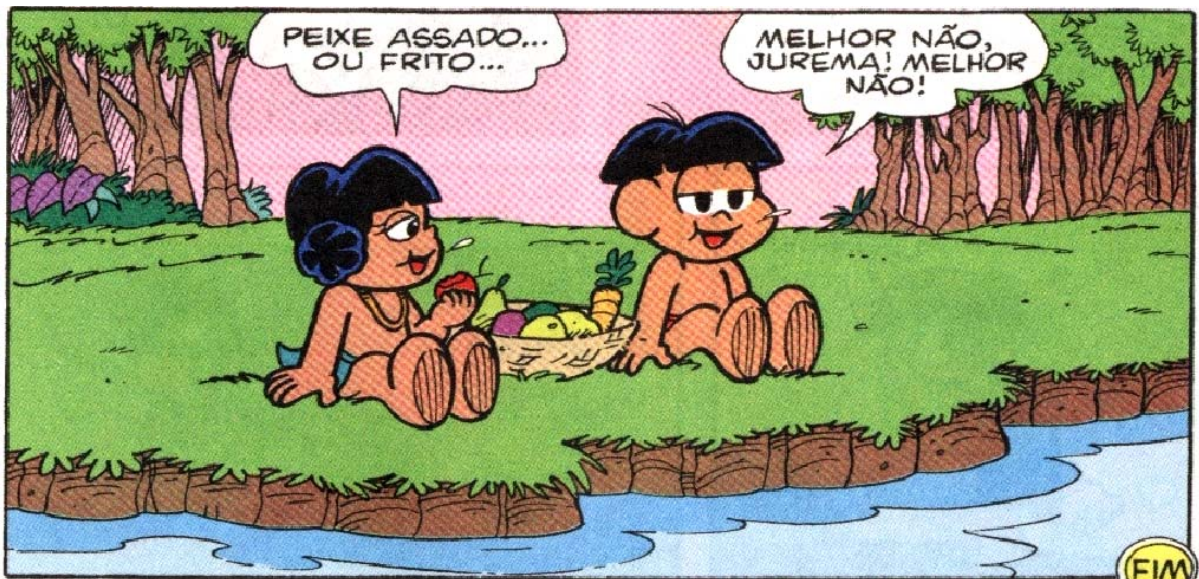
Figura 8 – Papa-Capim e Jurema celebrando a moral do sábio ambientalista

Fonte: História em quadrinhos do Papa-Capim intitulada “Peixes”. In: MAURICIO DE SOUSA PRODUÇÕES. Chico Bento. São Paulo: Panini Comics, 2011, n.53, p.25.