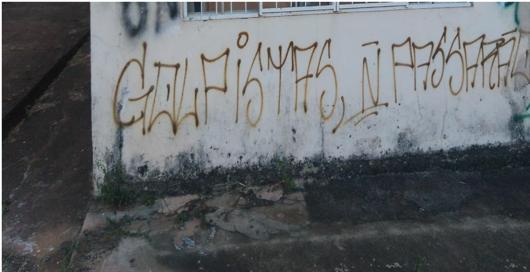
Figura 6: Golpistas, ñ passarão