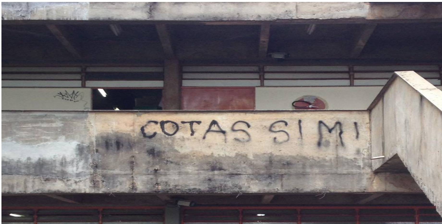
Figura 5: Cotas sim!