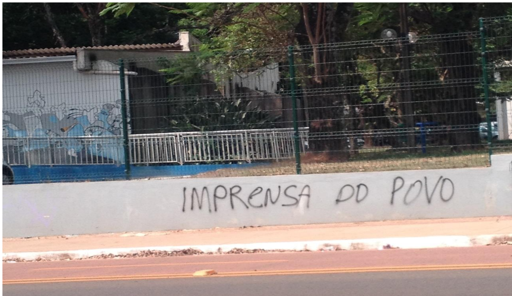
Figura 3: Imprensa do povo