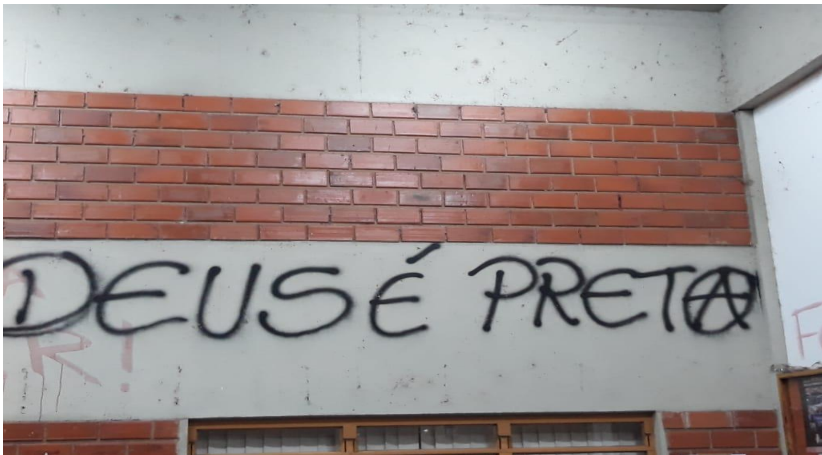
Figura 4: Deus é preto(a)