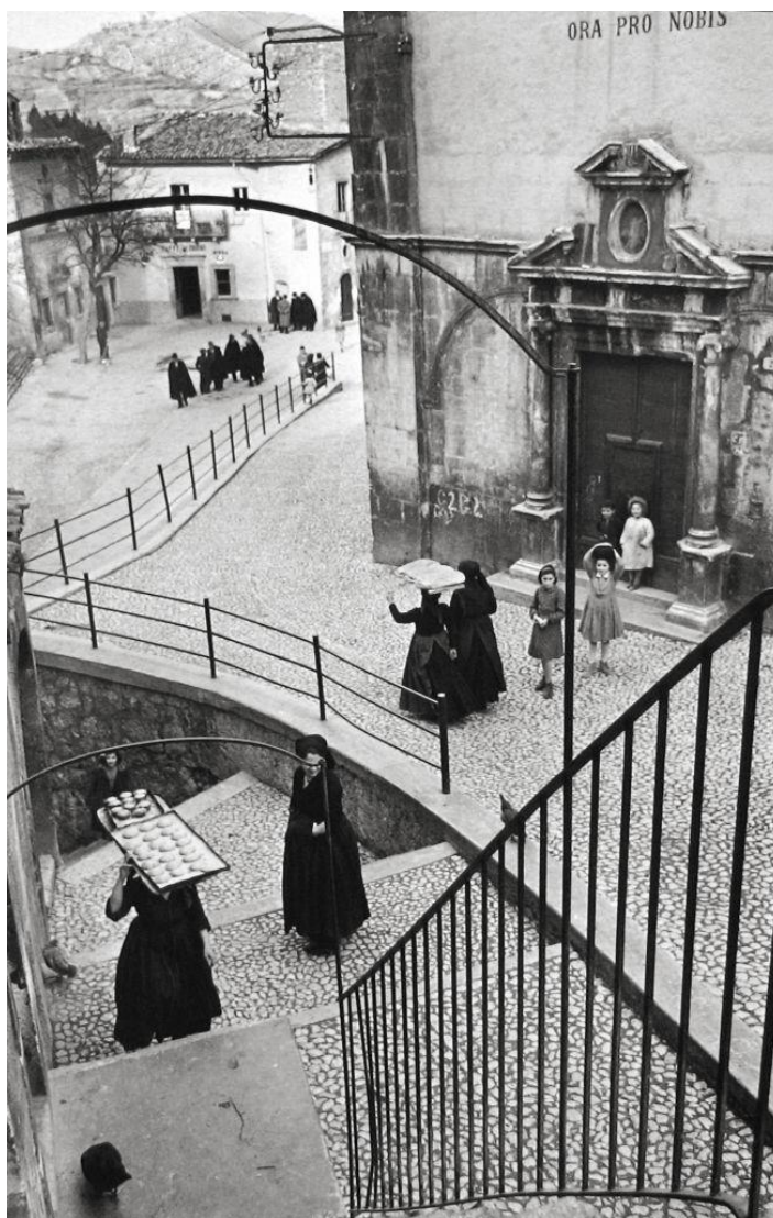
Figura 4 – Itália, 1952.

Fonte: Henri Cartier-Bresson, A história da arte (GOMBRICH, 1999, p. 624).