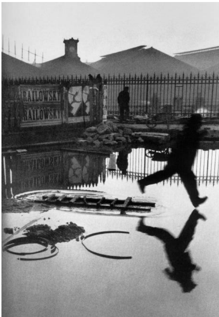
Figura 3 – Paris, 1932

Legenda do autor: Place de l'Europe, Paris, 1932. Havia uma cerca de pranchas em torno de alguns reparos atrás da Gare Saint Lazare, e eu estava espreitando os espaços com minha câmera nos olhos. Isso foi o que vi. O espaço entre as tábuas não era inteiramente largo o suficiente para a minha lente, razão pela qual a imagem é cortada à esquerda. 10