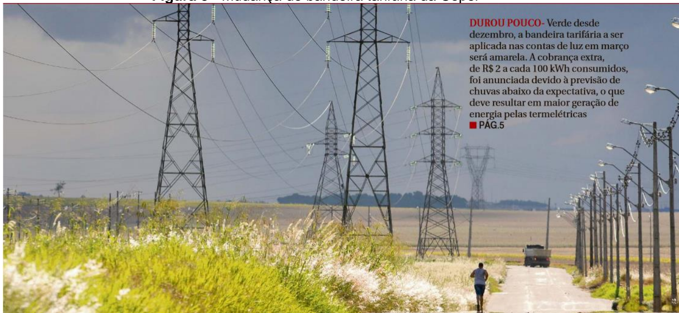
Figura 5 - Mudança de bandeira tarifária da Copel

linhas em perspectiva, está um caminhão quase saindo da imagem. Observa-se que no canto superior direito foi realizada uma inserção textual dentro do quadro da imagem. Este texto não cobre nenhum elemento, porém interfere na leitura imagética, uma vez que é informação adicionada ao quadro posteriormente ao momento do clique.