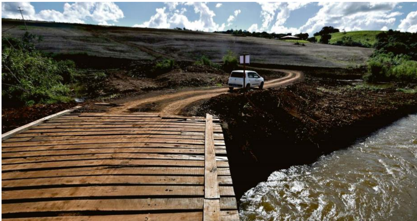
Figura 8 - Ponte improvisada sobre o Ribeirão Clementino

pela estrada na altura deste segundo plano. No terceiro plano está uma faixa de terra escura, aparentemente sem plantação no momento.