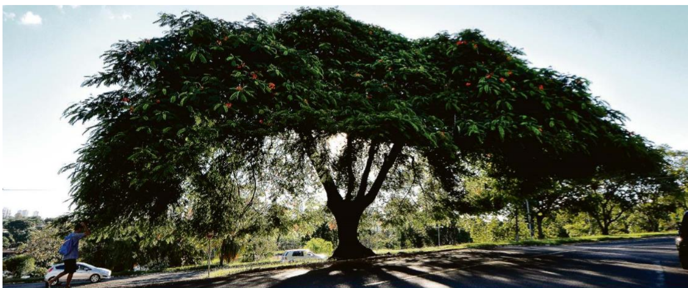
Figura 9 - Flamboyant

de árvores icônicas da cidade de Londrina que estão doentes e infestadas por pragas. Na imagem (Figura 9) vemos o flamboyant localizado na rua Senador Sousa Naves, em Londrina. Uma árvore imponente, que possui uma copa extensa e robusta, seu tronco é um tanto largo, porém não muito alto. Observa-se que a grandeza na estatura da árvore está em sua copa. Presentes na imagem, porém de forma secundária, estão carros ao fundo e um menino que caminha no canto esquerdo logo abaixo da árvore. Através deste menino podemos fazer um comparativo do tamanho da árvore e a proporção de sua copa que cresce de forma horizontal.