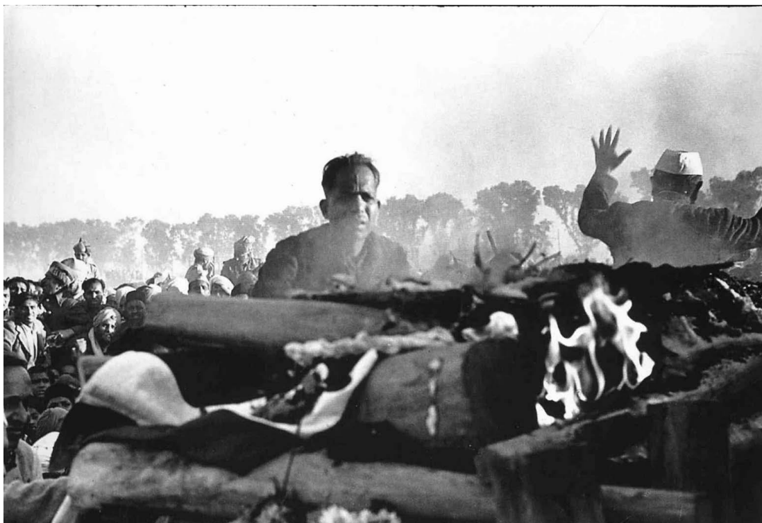
Figura 1 – Cobertura do funeral de Gandhi, 1948

Legenda do autor: Nova Déli, 1948. A primeira chama da pira no funeral de Gandhi. Seu secretário olha para a chama; Seu médico levanta suas mãos esperando silenciar a multidão; Mas à medida que a pira queima mais brilhante, as pessoas pareciam estar em chamas também - e eles avançaram em um grande movimento esmagador, jogando-se em direção à pira. 7