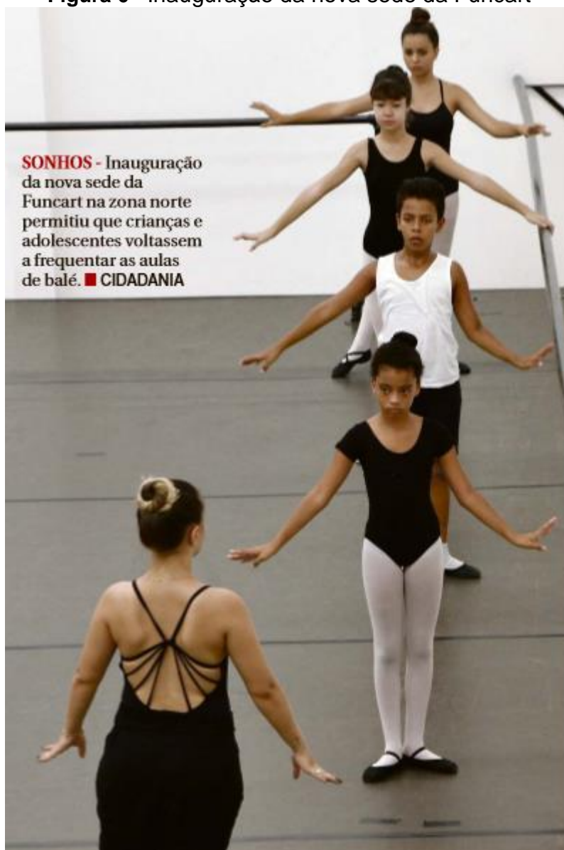
Figura 6 - Inauguração da nova sede da Funcart