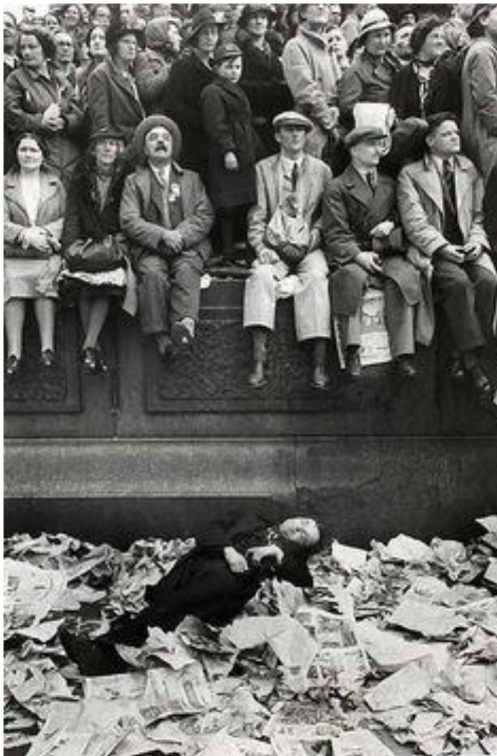
Figura 2 – Coroação do rei George VI, 1938

Legenda do autor: Londres, 1938. As pessoas haviam esperado a noite toda em Trafalgar Square para não perder nenhuma parte da cerimônia de coroação de George VI. Alguns dormiram em bancos e em jornais. Na manhã seguinte, um mais cansativo do que os outros ainda não tinha acordado para ver a cerimônia para a qual ele manteve uma vigília tão longa. 8