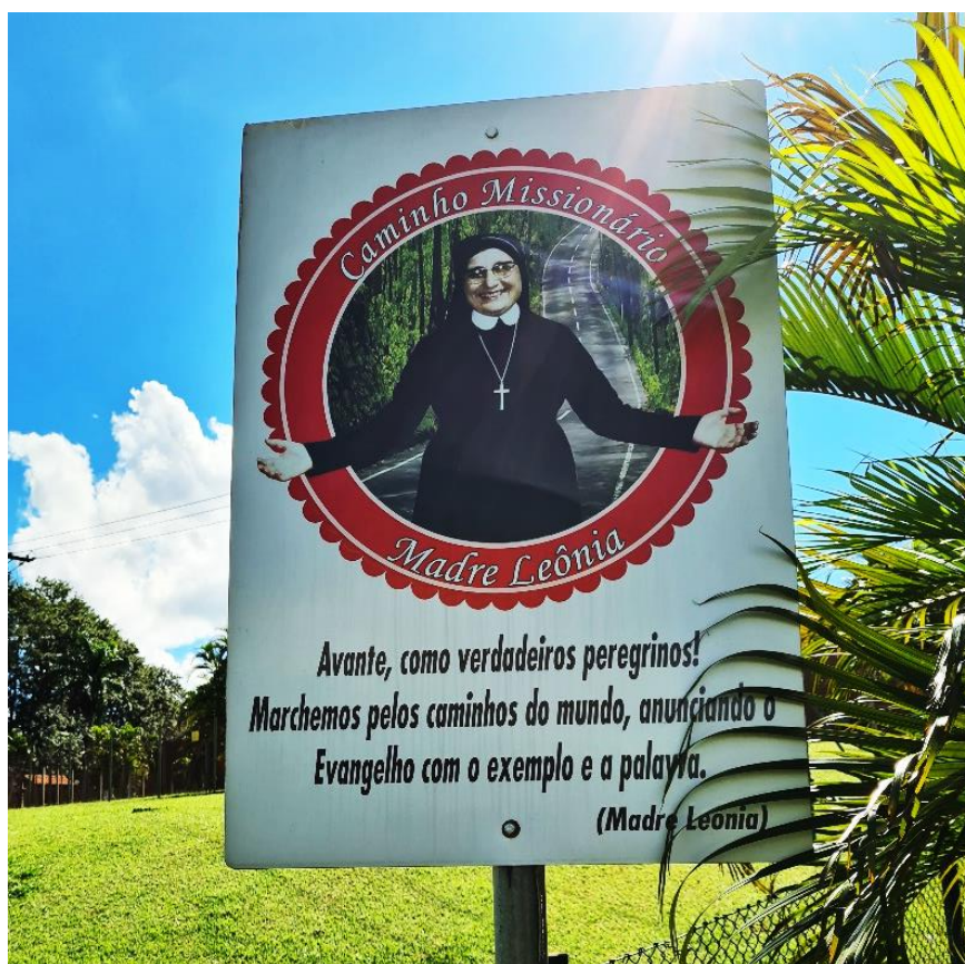
Figura 09. Detalhe da placa à esquerda da capela Nossa Senhora do Caminho, Cambé (PR), 2021.

Por sua vez, na figura 09 encontra-se uma placa localizada fora dos limites da cerca e indica a existência de uma rota de peregrinação intitulada como “Caminho Missionário Madre Leônia”. Dessa vez, ainda com a estrada como plano de fundo, a fotografia da religiosa sorridente e receptiva está dentro de um selo, como referência a parte de um trajeto que leva o seu nome.