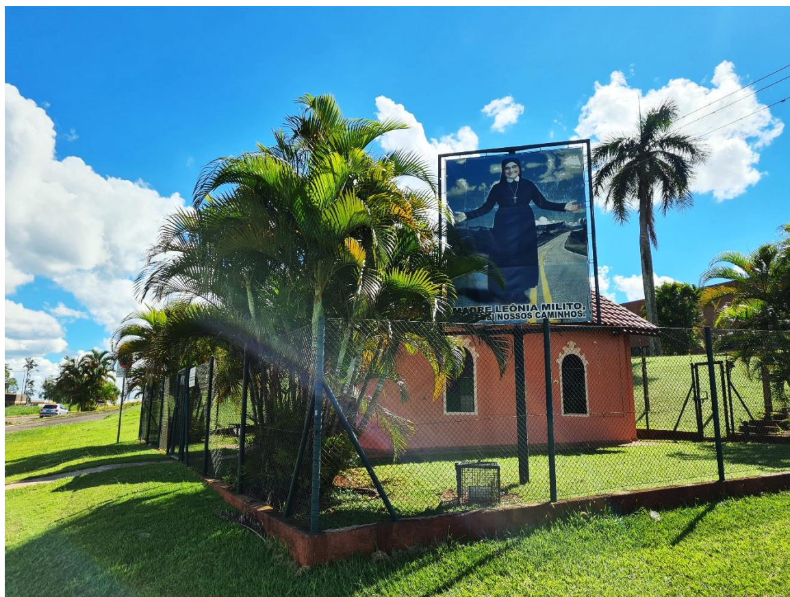
Figura 08. Detalhe do painel à direita da capela Nossa Senhora do Caminho, Cambé (PR), 2021.

Ainda neste âmbito, as figuras 08 e 09 apresentam duas projeções de Leônia Milito enquanto um símbolo de proteção e motivadora dos peregrinos. Em ambas, a mesma fotografia empregada no jardim da casa de memória foi utilizada para integrar o espaço, porém neste caso, em vez da representação de um jardim, são imagens de estradas vazias ao fundo da fotografia.