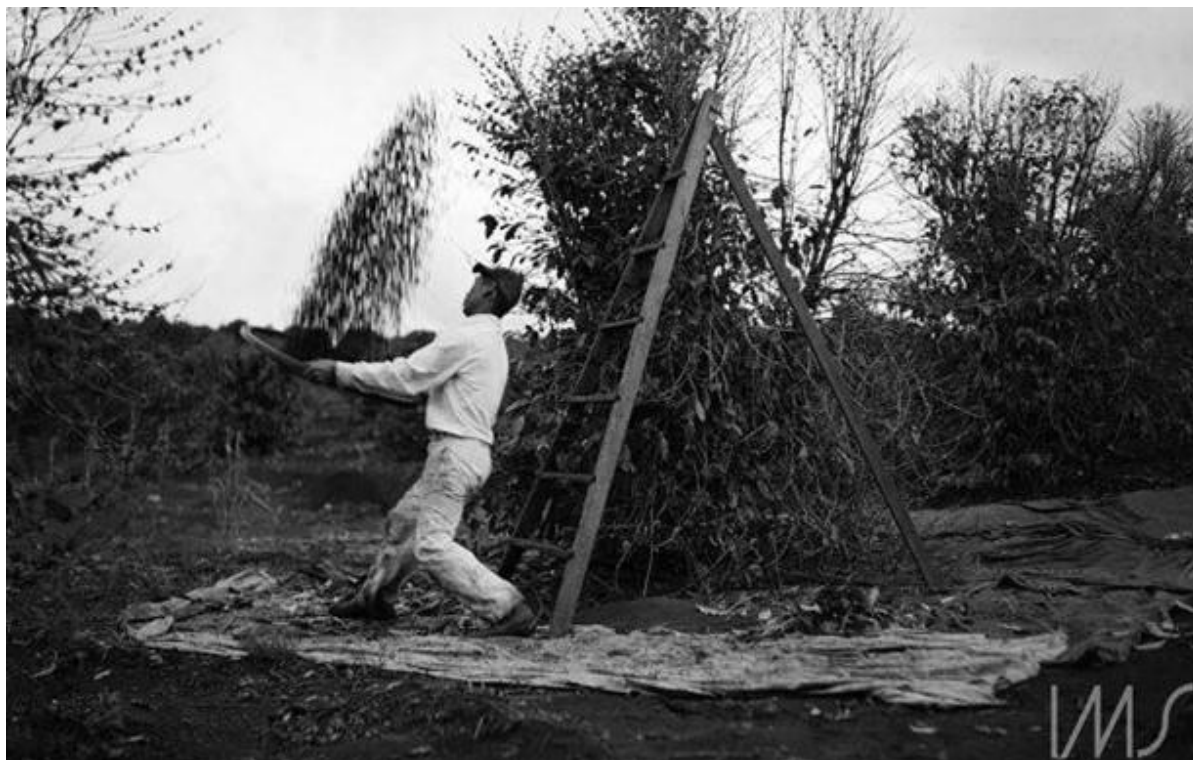
Figura 03. Hideomi abanando café durante a colheita, Fotografia de Haruo Ohara. Londrina, Paraná, 1946. Acervo Instituto Moreira Salles.

No primeiro plano, Ohara captura um instante do cotidiano da cultura cafeeira, da experiência manual do primeiro processo de higienização do café, ao lançar os grãos contra o vento, as folhas, gravetos e pequenas impurezas são separadas naturalmente do restante da colheita. Ao lado de Hideomi, o indivíduo identificado na imagem, encontra-se uma escada construída manualmente para alcançar os frutos mais altos do cafeeiro. No chão uma lona estendida faz com que aquilo que foi colhido não seja perdido na terra vermelha. O agricultor, o cafeeiro e as ferramentas de trabalho (lona, escada e peneira) são os elementos centrais da fotografia que se apresentam em uma triangulação e sugere que essa tríade reflete a rotina do campo. A experiência do tempo da colheita, do cuidado e da morosidade de abanar cada pé de café se distingue da velocidade do desenvolvimento e progresso presentes nas imagens de Juliani.