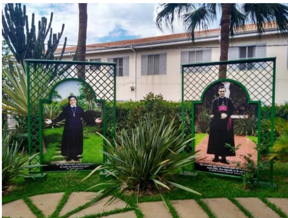
Figura 06. Painéis do jardim da casa “berço” da Congregação das Missionárias de Santo Antônio