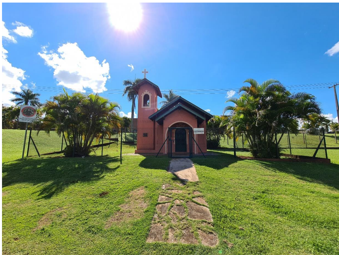
Figura 07. Fachada da capela Nossa Senhora do Caminho, Cambé (PR), 2021.