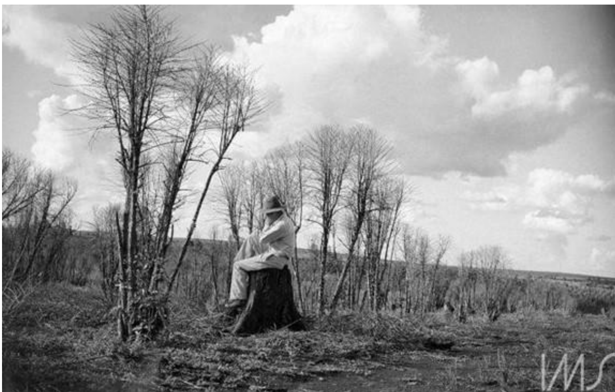
Figura 04: Autorretrato. Londrina, Paraná, na década de 1940.

A figura 04 acentua a interação entre os elementos da natureza e o homem em uma lógica diferente da propagandista/comercial. A imagem apresenta no primeiro plano alguns pés de café secos, sem folhas e sem frutos, que sofreram os efeitos da geadada. Entre o cafezal está o próprio Ohara sentado em um tronco serrado de uma árvore numa posição reflexiva, prostrado com uma das mãos em seu chapéu que cobre seu rosto, cabeça baixa em meio ao cenário hostil proporcionado pelas forças da natureza.