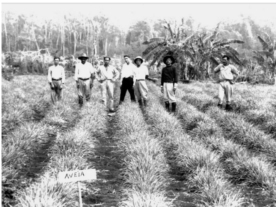
Figura 02. Cultivo de aveia. Década de 1940. Autor: José Juliani. Acervo Museu Histórico de Londrina

processo de reocupação do norte do Paraná. Suas fotografias enquanto funcionário da Companhia apresentam uma imagem positiva do empreendimento, da vitória do homem sobre a natureza, com imagens posadas que transmitem ao espectador a noção de grandeza e fertilidade da terra além de refletir os objetivos do projeto (re)colonizador de promover o progresso e desenvolvimento econômico para o Norte do Paraná. Enquanto fotógrafo de rua, suas lentes registraram uma série de retratos de transeuntes, indivíduos comuns e famílias que o procuravam nas ruas do centro da cidade ou em seu estúdio (UNIVERSIDADE; MUSEU, 2011). No entanto, apesar da temática da pobreza estar vinculada aos indivíduos comuns, nos ocuparemos em analisar sua produção enquanto funcionário da CTNP para problematizar o discurso presente em suas imagens a fim de perceber a ausência de qualquer condição de subdesenvolvimento. Observa-se na figura 02 três planos que compõem a fotografia.