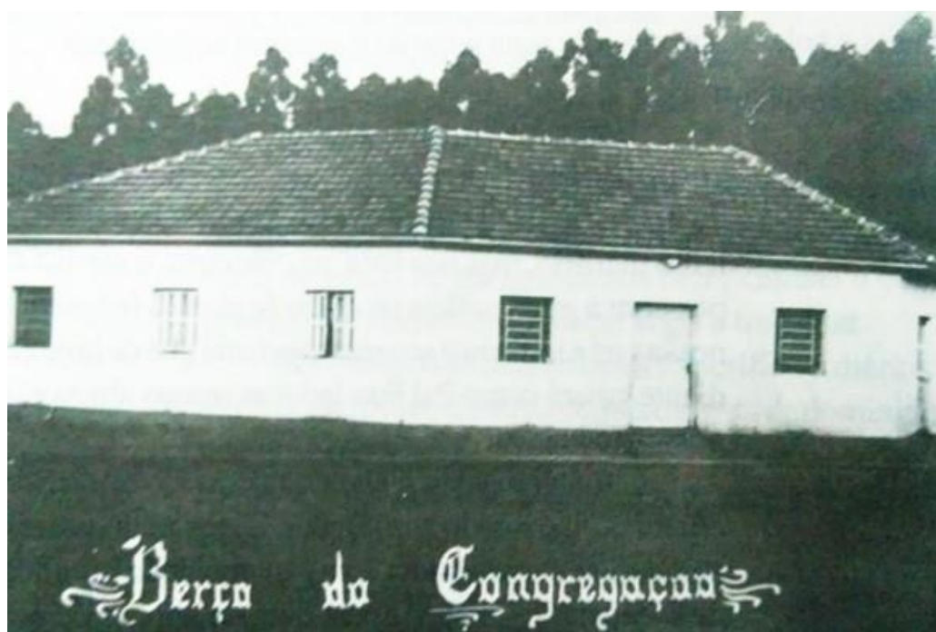
Figura 05. A “Casa Berço”, primeira sede da Congregação das Missionárias de Santo Antônio Maria Claret. Atualmente o local abriga a casa de memória Madre Leônia Milito. Final da década de 1950.

Ao longo do processo de canonização de Leônia Milito essa construção foi transformada – com poucas alterações estruturais – num espaço de memória utilizando os cômodos, objetos e mobiliário originais da congregação. Em 2006 foi inaugurada a Casa de Memória Madre Leônia Milito, um espaço dedicado a memória da fundadora e, de forma indissociável, a história da congregação religiosa. Em 2011, a casa berço obteve maior notoriedade política e social a partir da assinatura da lei municipal Nº 11.458/2011 que reconheceu o espaço como um local de interesse histórico, turístico e cultural na cidade. Na imagem a seguir está o registro fotográfico do imóvel no ano de fundação da congregação religiosa.