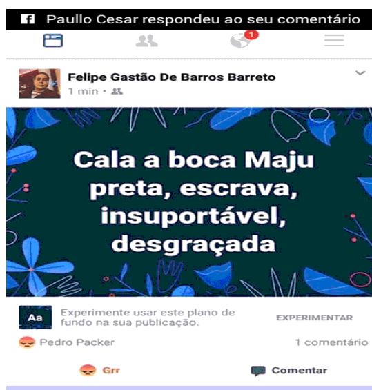
Imagem 8 - Racismo Estrutural