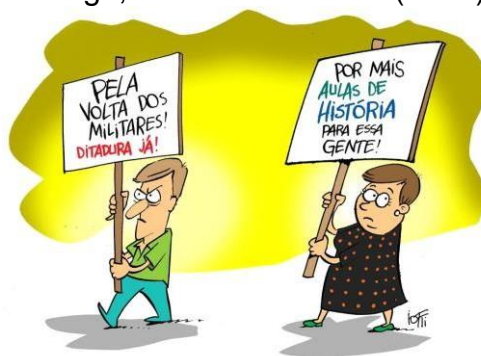
Imagem 1: Por mais aulas de História 12

No mesmo artigo, Bauer e Nicolazzi (2016) analisam uma charge da época: