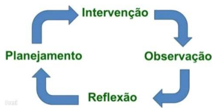
Imagem 2: esquema pesquisa-ação

Dinâmica cíclica, a pesquisa-ação envolve uma constante e interminável observação, reflexão, planejamento e intervenção, podendo modificar seu começo ou final: