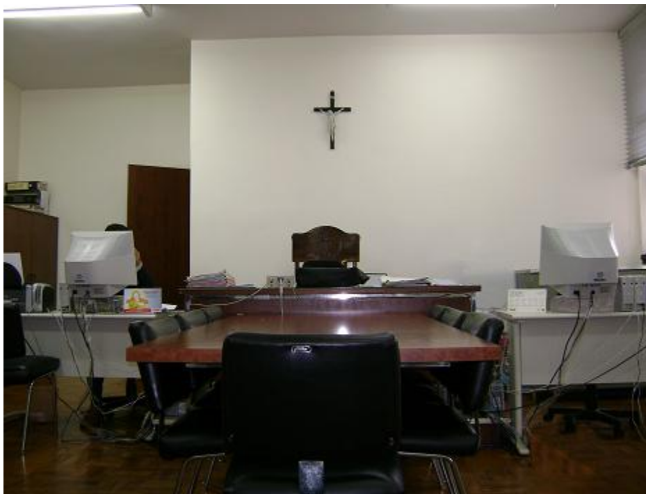
Sala de Audiência do Fórum de Ourinhos – agosto de 2007