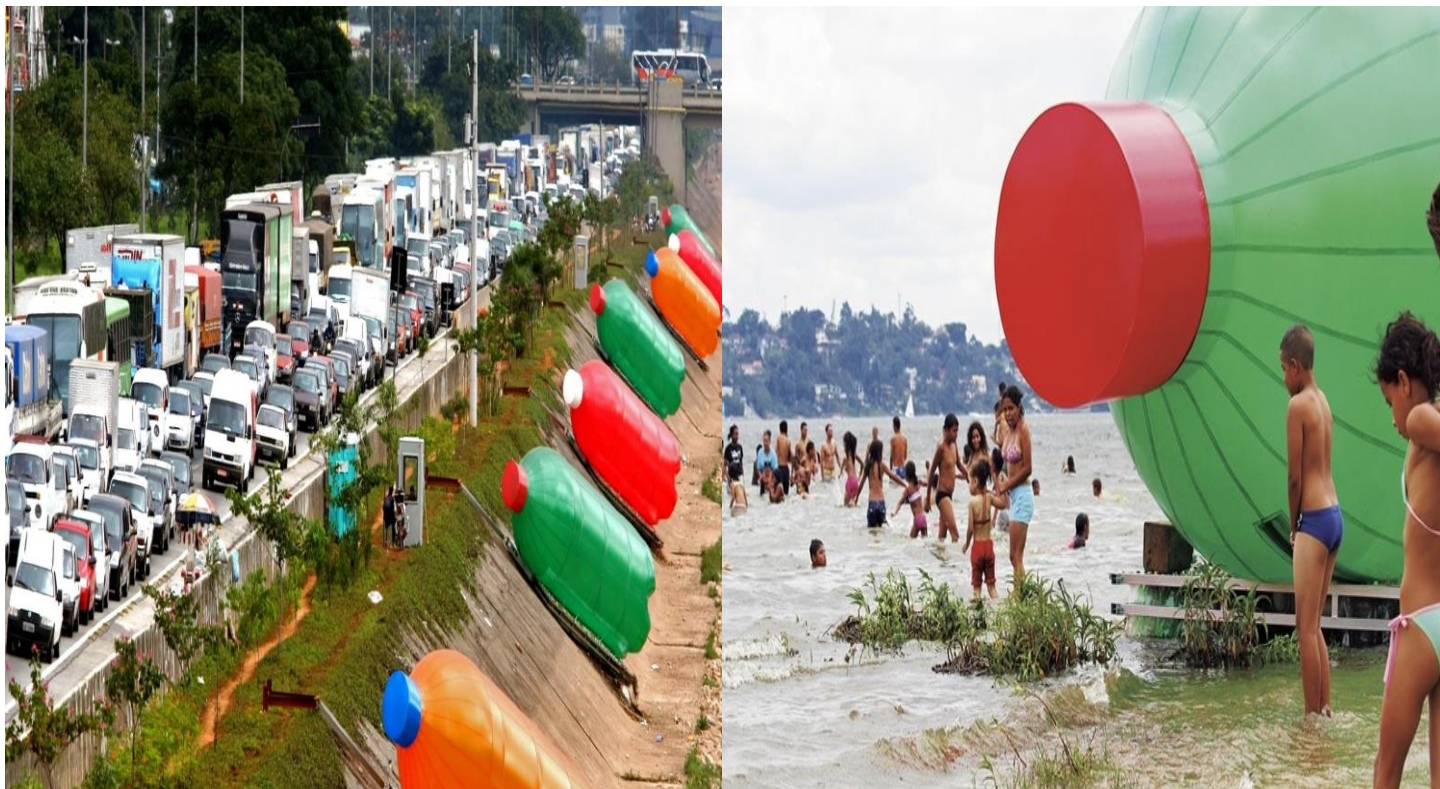
Figura 3. Fotografias de instalações referentes ao projeto PETS , do artista plástico paulistano Eduardo Srur.

Sul (Bienal Sul) em diversas localidades da Argentina. Já ocupou o Rio Tietê (2008), a represa Guarapiranga (2010), o lago de Bragança Paulista (2012) e a praia de Santos (2014).