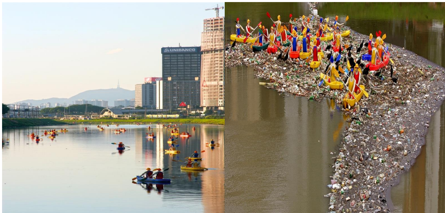
Figura 4. Fotografias de instalações referentes à obra Caiaques , do artista plástico paulistano Eduardo Srur.

Nela, cento e cinquenta esculturas compostas por caiaques de plástico e remos de alumínio, manequins de plástico, roupas de tactel , parafusos e cabos de aço são lançadas a certa altura do rio Pinheiros, localizado na cidade de São Paulo. Não se detendo ao caráter de fixidez exigido em PETS , as esculturas boiam e transitam conforme o devir das águas e, um efeito estético curioso está demonstrado na segunda figura, em que as esculturas se aglomeram numa “ilha” de lixo superficial, acentuando contornos que muito remetem ao mapa do Brasil, um efeito não planejado pelo autor da obra.