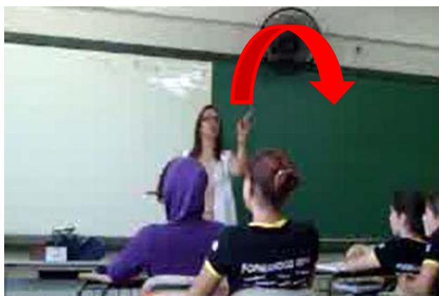
Figura 3 – Professora indica a troca de turno para a fala dos alunos

O agir da professora demonstra que ela faz a reconcepção das prescrições (DCE e de seu PTD), ou seja, adapta o trabalho prescrito pelo discurso oficial e autoprescrito em seu Plano de Trabalho, documentos que enfatizam as práticas discursivas (materializadas em gêneros textuais) como objeto centralizador do ensino de LP. Ela redefiniu as prescrições de acordo com a sua base de orientação (SCHNEUWLY, 2009) sobre a situação escolar em que se encontra, adaptou os gestos profissionais que são comuns no métier e, portanto, são fundadores do ofício ao seu estilo singular. Como ator que tem motivos e intenções particulares de acordo com a sua base de orientação da situação em que se encontra, (re)definiu, (re)concebeu a dinâmica do conteúdo estruturante para a área de LP para a leitura, passando o turno aos alunos no final de cada verso, gesto com o qual enfatizou a sonoridade das rimas do poema. A imagem a seguir representa um momento do agir da professora: