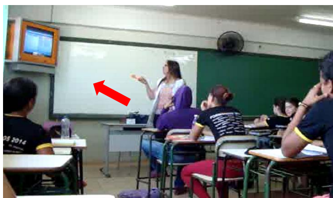
Figura 2 – O agir da professora diante da TV multimídia

A imagem que vem a seguir representa a professora diante de seus alunos, em uma interação frontal que dá a ela a posição de “guia das discussões”, posição assimétrica pela qual dirige e controla a tomada de turnos dos alunos, indicando a direção da TV com a mão que segura o controle remoto.