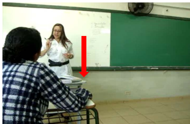
Figura 12 – Apelo à memória da professora

A PP escreve no quadro a estrutura básica do gênero textual soneto e desenha novamente a organização dos versos, utiliza-se do gesto icônico, para ilustrar o que está sendo dito, e do gesto dêitico, para indicar no quadro o que está falando. Nesse agir, recorre assim aos gestos de presentificação, elementarização e apelo à memória ao mesmo tempo. Ou seja, a distinção dos gestos didáticos realizada por Aebly-Daghé e Dolz (2008), Scheneuwly (2009) e Nascimento(2011; 2014) configura-se como uma organização apenas didática, pois o professor pode ao mesmo tempo realizar mais de um gesto didático, conforme demonstramos, com intuito de instrumentalizar sua aula para provocar desenvolvimento nos alunos e por vezes em si mesmo.