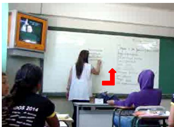
Figura 4 – O que pensam os alunos nos registros da lousa

A PP recorre ao gesto de presentificação do objeto de ensino ao registrar no quadro as concepções dos alunos sobre “ser jovem” que vão emergindo no debate. Esse registro na lousa também constitui um gesto didático fundador – o gesto de apelo à memória didática para trazer de volta objetos anteriormente tratados, já que as ideias registradas na lousa nortearão a produção de textos. Pelos gestos de apelo à memória didática, a professora resgata objetos já trabalhados para permitir a articulação com o novo objeto de saber