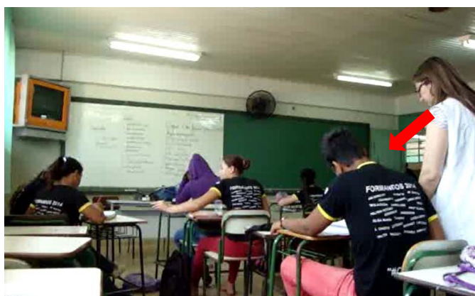
Figura 9 – Circulando pela sala de aula para regular a tarefa

Além disso, ela consegue elaborar e diversificar seus gestos de regulação da tarefa, ora desenhando uma figura no caderno do aluno, ora escrevendo uma frase, ou uma palavra, ou grifando uma parte do texto enquanto caminha por entre as carteiras. A imagem a seguir representa o gesto de regulação da tarefa dos alunos: