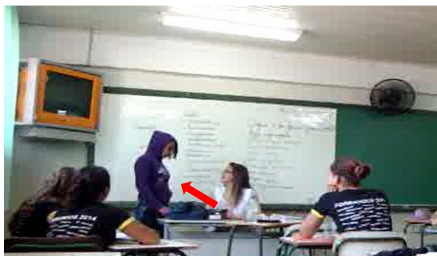
Figura 7 – A regulação da tarefa da aluna

Contextualização do agir: a regulação da tarefa