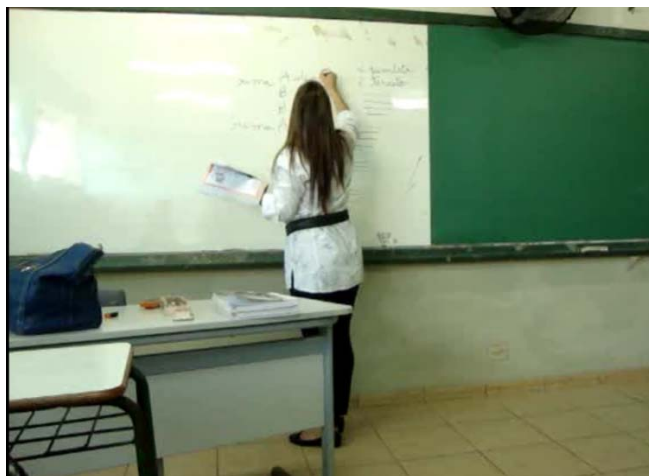
Figura 13 – Professora escreve no quadro as rimas conforme o livro

Observa-se uma pausa na sua exposição, no momento em que ela tenta lembrar dos tipos de rimas. Não consegue, e então recorre ao livro para lembrar, buscando mediação para o seu gesto de apelo à memória. Ao diagnosticar sua dificuldade, rapidamente vira-se para a lousa para registrar a ordem das rimas pelo gesto de presentificação: mostra o objeto de ensino e as rimas do soneto, colocando em cena o dispositivo didático, neste caso o texto.