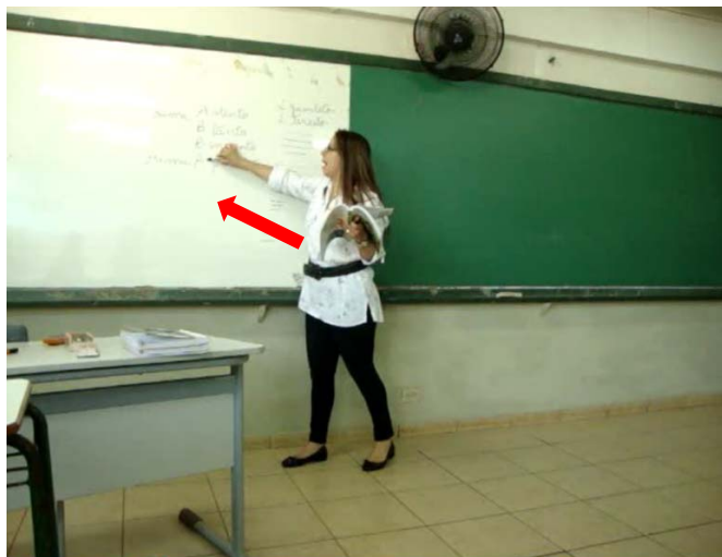
Figura 14 – Indicação das rimas