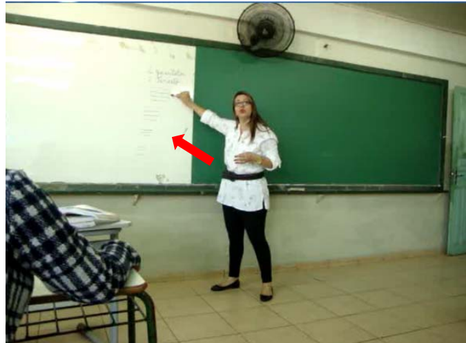
Figura 11 – Retomada da aula anterior