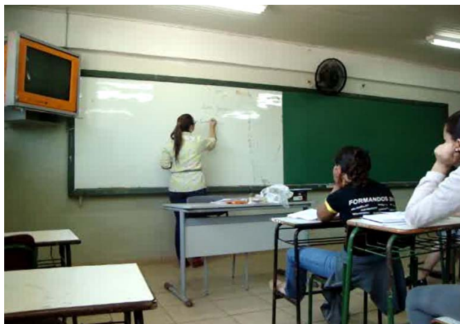
Figura 17 – Introdução de um novo gênero textual