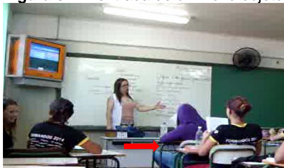
Figura 6 – A entrada de um novo objeto de ensino