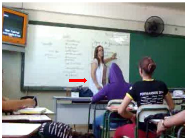
Figura 5 – A lousa mediando a elementarização do objeto de ensino

Como se planeja um soneto: organizando os versos em dois quartetos e dois tercetos”.