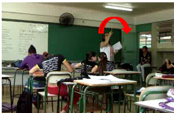
Figura 10 – Institucionalizando o objeto de estudo