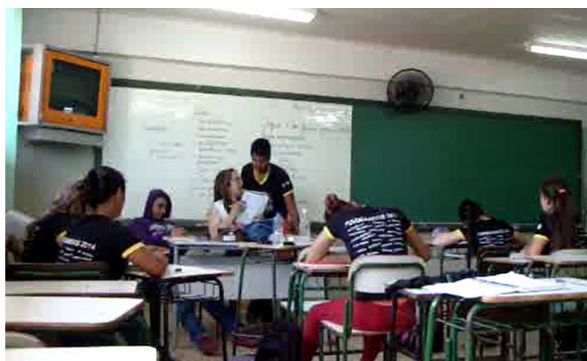
Figura 8 – Correção dos textos dos alunos individualmente

ensino pelo qual se focalizam partes particulares do objeto. Isso implica uma desconstrução do objeto para a colocação em evidência de certas dimensões que ela recortou do objeto, gesto fundamental para que porções menos complexas entrem no foco de atenção do aluno. A imagem a seguir representa esse movimento intenso de elementarização do objeto de ensino em uma interação oral que a professora materializa individualmente com cada aluno que dela se aproxima.