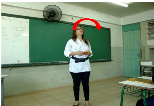
Figura 15 – Indicação com a cabeça